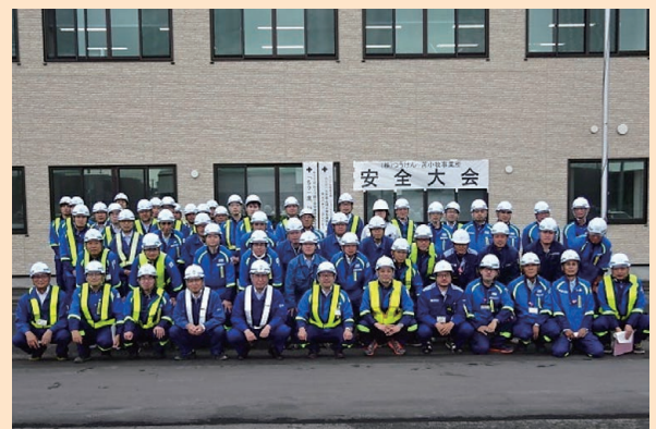
写真3 苫小牧事業所前にて集合写真

周りの社員や協力会社の方々のサポートがあつての受賞だと思っていますので“感謝”の気持ちを忘れずに、今後も成長していきたいと思っています。