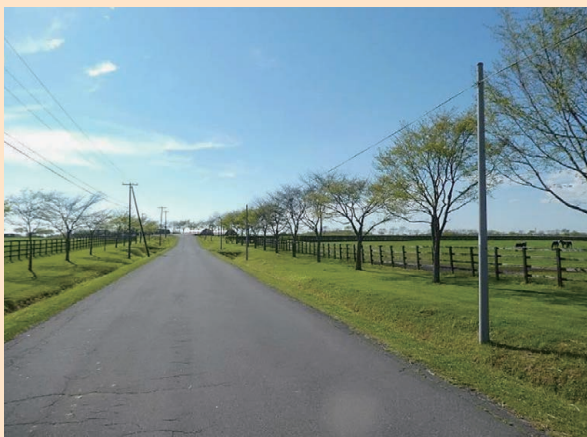
写真1 牧場付近の景観

苦小牧管内ではサラブレッドを生産、育成している牧場が多数あり (写真1)、競走馬を刺激しないよう施工時期や時間指定の折衝に配慮しています。