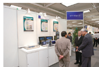
写真7 NTTグループ会社による展示