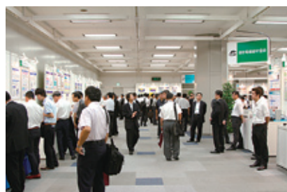
写真6 通信電線線材協会による展示

さまざまなソリューション提案等のほか、NTTネオメイト、NTTアドバンステクノロジーなどNTTグループ各社様からの出展（表3）もあり、多岐にわたる素晴らしい展示となりました（写真3・4・5・6・7）。