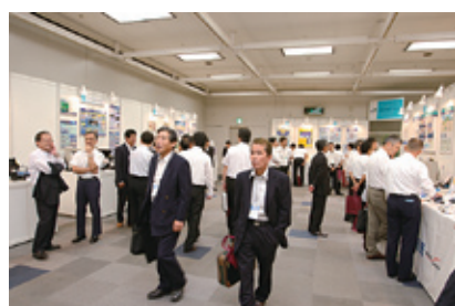
写真5 全国通信用機器材工業協同組合 (全通協) による展示