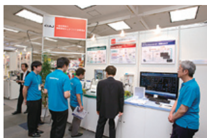
写真4 情報通信ネットワーク産業協会 (CIAJ) による展示