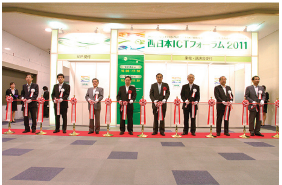
写真2 テープカットによる開幕