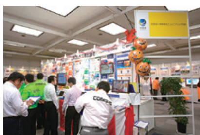
写真3 情報通信エンジニアリング協会 (ITEA) による展示