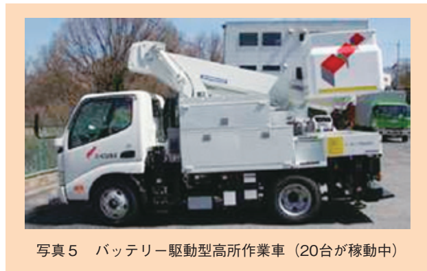
写真5 バッテリー駆動型高所作業車(20台が稼動中)