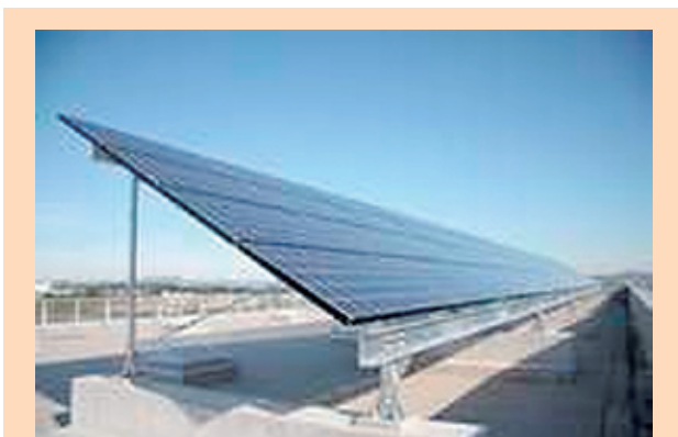
写真11 直営施工した太陽光発電設備 (坂祝ビル (岐阜県))

社会からの公共的あるいは福祉向上等のニーズに応えることは、社会の一員としての責務です。シーキューブは、地域社会の要請を踏まえたさまざまな社会貢献活動を実施しています。高専等からのインターンシップ受入れや障害者雇用といっ