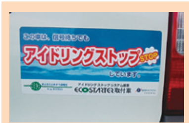
写真9 アイドリングストップ車の表示マーク (50台に取付け)