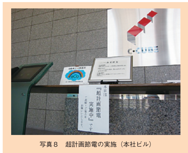
写真8 超計画節電の実施(本社ビル)