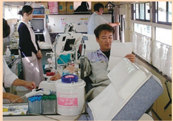
写真14 献血協力（静岡支店）

た教育、自立への支援活動、シーキューブ版タイガーマスク運動（年間を通じた募金活動）や社会福祉協議会等への賛助、エコキャップ収集、使用済み切手や未使用はがきの収集、献血協力等の人道的活動、近隣清掃、地元イベント等への協賛やスポーツ後援といった地域貢献活動に取り組んでいます（写真13・14）。今後とも良き企業市民として地域と一体となった活動を継続し、社会との共生を図っていきます。