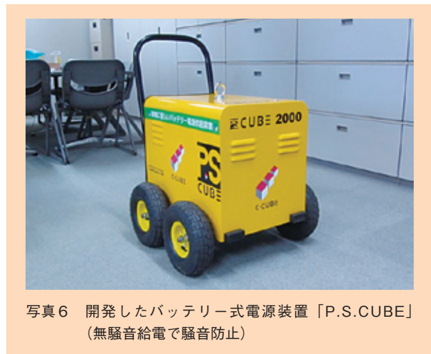
写真6 開発したバッテリー式電源装置「P.S.CUBE」(無騒音給電で騒音防止)