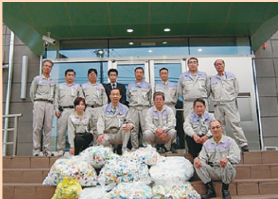
写真13 回収したエコキャップを前に（愛知支店）