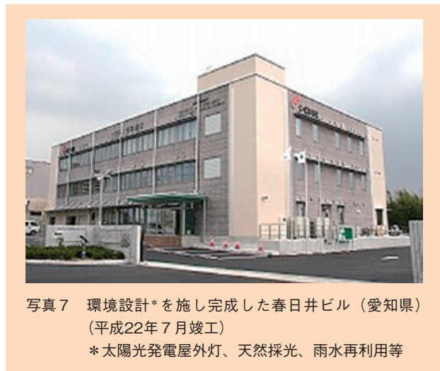
写真7 環境設計*を施し完成した春日井ビル(愛知県) (平成22年7月竣工) *太陽光発電屋外灯、天然採光、雨水再利用等