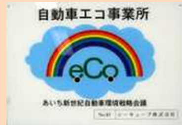
写真10 名古屋市認定エコ事業所 (左) と愛知県認定自動車エコ事業所