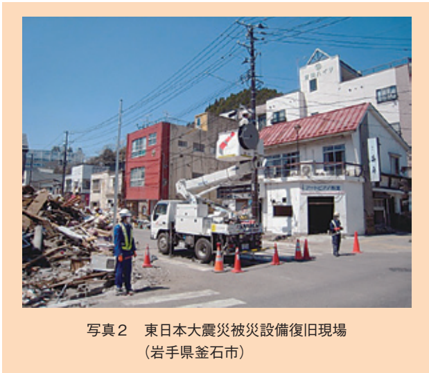
写真2 東日本大震災被災設備復旧現場 (岩手県釜石市)