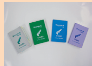
写真15 現場必携の安全作業心得（左から線路宅内、土木、ネットワーク、移動無線の各編）