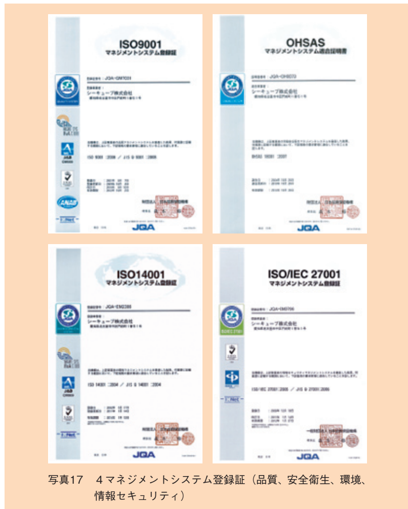
写真17 4 マネジメントシステム登録証（品質、安全衛生、環境、情報セキュリティ）

以上、シーキューブが取り組むCSR活動について紹介しました。社会インフラとして、あるいはさまざまな問題解決の手段として、IT技術は今後とも重要な役割を果たします。シーキューブはIT分野の一翼を担う総合エンジニアリング企業として、社会にさまざまな価値を提供することにより、社会とともに成長し発展していきたいと考えています。