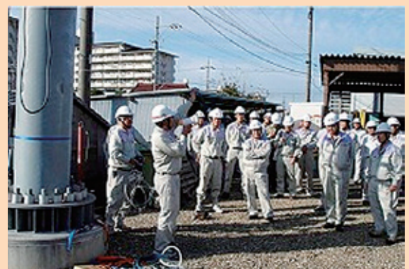
写真16 安全実践演習（移動通信部門）