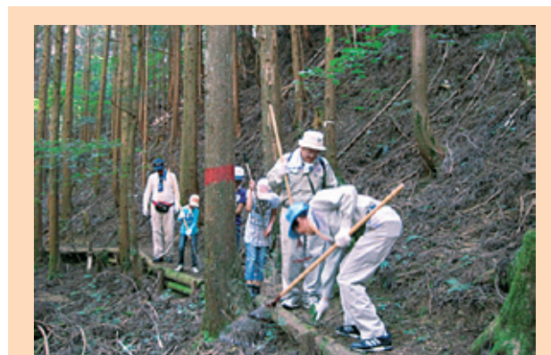
写真12 「シーキューブの森」活動 (遊歩道の整備をする参加者)