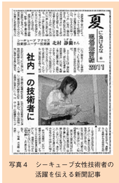
写真4 シーキューブ女性技術者の活躍を伝える新聞記事

のために社会全体で取り組むべき重要課題であり、当然企業もその責任を果たす必要があります。シーキューブは、環境関連法令の遵守により廃棄物管理、浄化槽管理の徹底等を図るほか、以下の取組みにより環境保護に貢献しています。