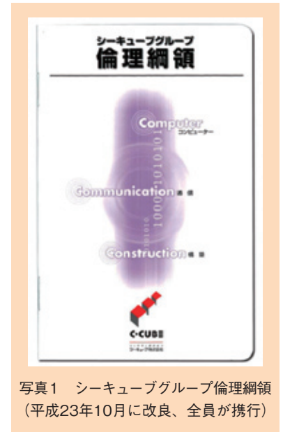
写真1 シーキューブグループ倫理綱領（平成23年10月に改良、全員が携行）

法令等の遵守や倫理的な行動の実践によるコンプライアンスの徹底は、社会的責任の基本をなすものです。このことから、シーキューブでは全役職員の行動指針として「シーキューブグループ倫理綱領」を定め、その推進を図っています。また、社長を委員長とするコンプライアンス委員会を設置し、全社をあげて社