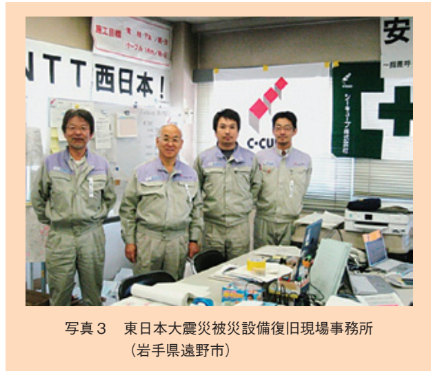
写真3 東日本大震災被災設備復旧現場事務所 (岩手県遠野市)