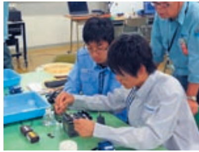
光ファイバ接続実習