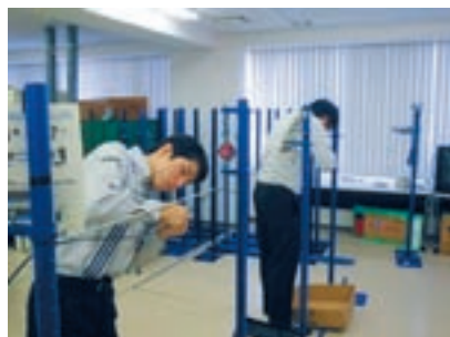
クロージャ取付け実習