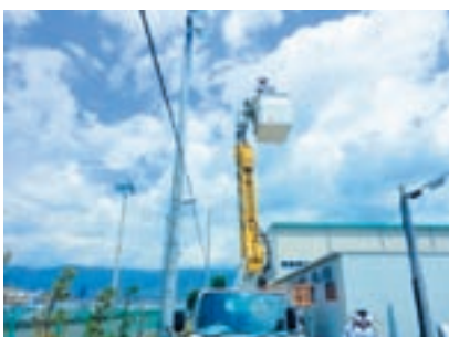
高所作業車搭乗体験