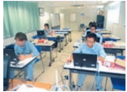
PCのセットアップ実習