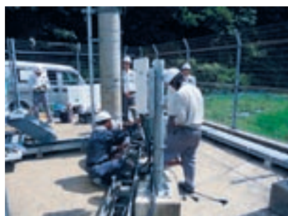
モバイル設備工事現場見学