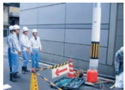
電柱撤去工事現場見学