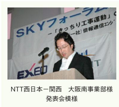
NTT西日本-関西 大阪南事業部様 発表会模様