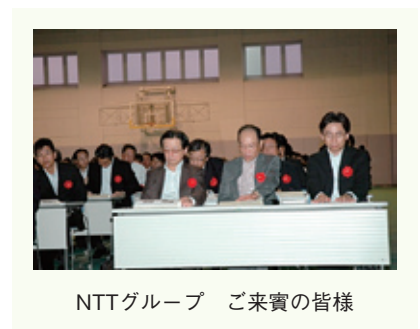
NTTグループ ご来賓の皆様