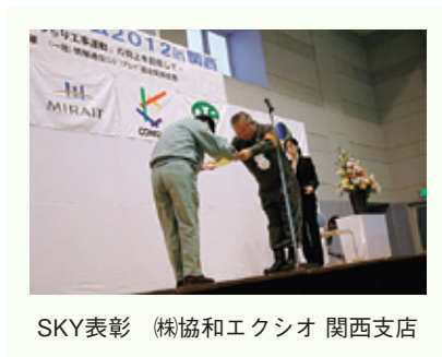
SKY表彰 (株)協和エクシオ 関西支店