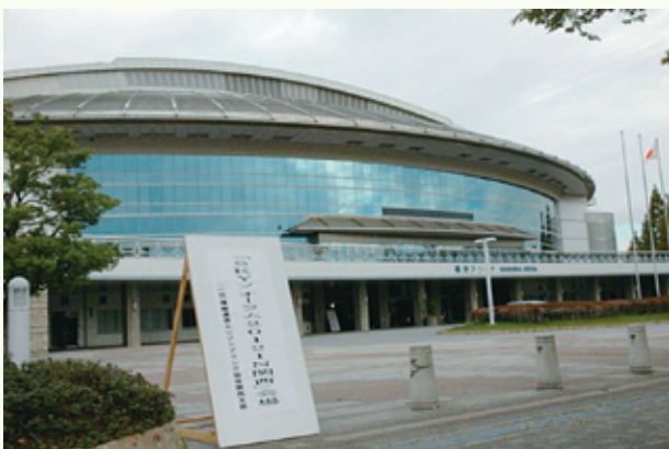
「SKYフォーラム2012 in 関西」会場 舞洲サブアリーナ