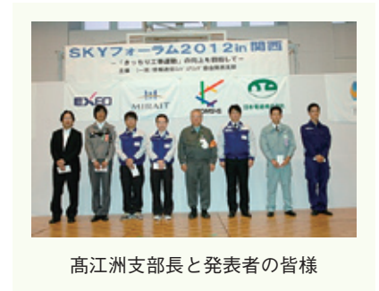
高江洲支部長と発表者の皆様