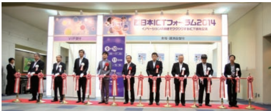
写真2 テープカットによる開幕