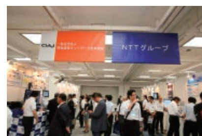
写真7 NTTグループ会社による展示