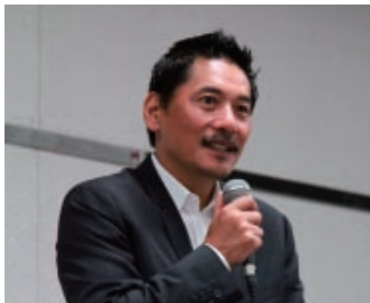
写真10 神戸製鋼ラグビー部ゼネラルマネージャー 平尾 誠二様による特別講演