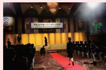
レッドカーペットを歩くクラブBPC認定者