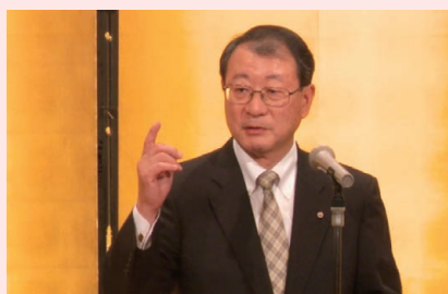
NTT西日本 村尾社長 ご挨拶