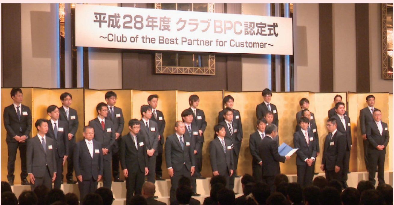
平成28年度クラブBPC認定式