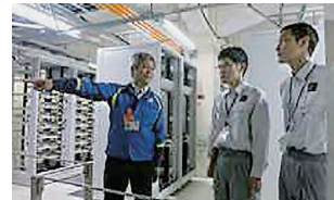
ネットワーク系業務の体験