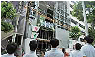
新築マンションの通信設備・電気設備工事見学