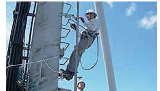
LTE基地局建設工事見学