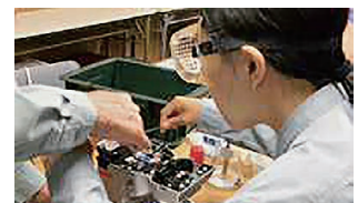
写真8 光ケーブル接続(融着)