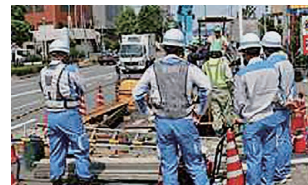
建柱作業現場見学