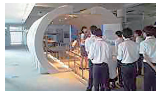
写真3 NTT技術史料館見学