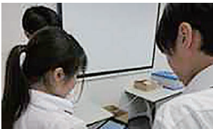
サイトサーバイ実習