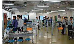
写真1 光開通工事実習

①関東エリア:東日本研修センターにおいて、講演、座学、光開通実習およびメタル開通実習、安全実習、NTT技術史料館・NTT東日本霞ヶ関ビル施設見学等を実