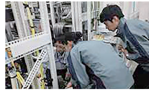
商業施設再開発工事見学