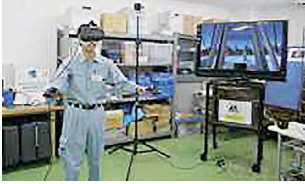
写真9 危険体感 (VR)