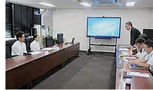
幹部講話・業務説明