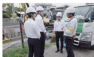
土木工事現場見学