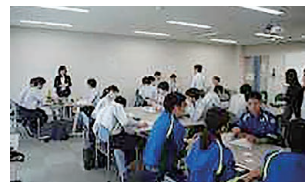
写真5 グループワーク