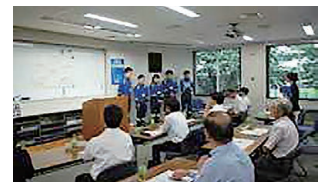
写真6 意見交換会:グループワーク結果発表

施するとともに、最終日にはグループワークを行い、学校関係者を迎え会員会社・ITEA職員参加による成果報告・意見交換会を実施しました(写真1～6)。