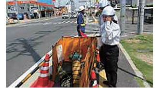
アクセス工事 (地下) 見学