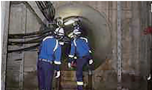
とう道補修工事見学