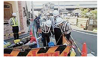
アクセス工事 (地下) 見学