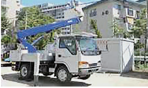
写真11 高所作業車体感