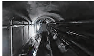
とう道補修工事見学