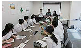
お客様への提案書作成体験