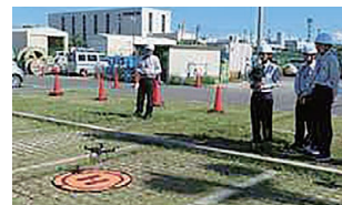
最新技術 (ドローン) 体験