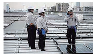
太陽光発電施設見学