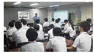
写真4 NTT東日本霞ヶ関ビルの通信設備見学