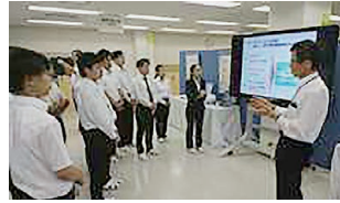
写真10 NTT西日本研修センターの施設見学